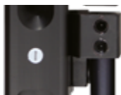
Unscrew the nylon screw to avoid the movement of your pistol when is holstered.